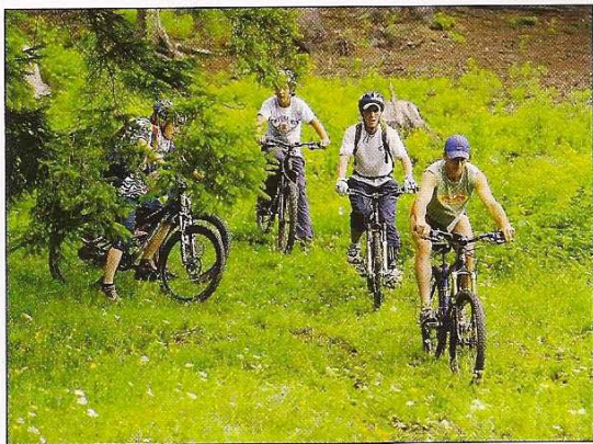
Cicloturismo in Romania. A destra, il Volo dell'Angelo tra Castelmezzano e Pietrapertosa.