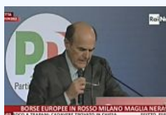
Bersani: siamo arrivati primi ma non abbiamo vinto