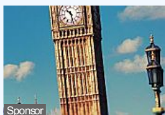
Imparare l'inglese? 5 motivi per cui è meglio farlo subito (Kaplan International)