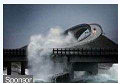
10 strade così pericolose da essere mortali (Hitparade)