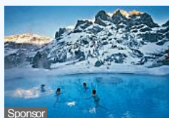
Le 10 terme più belle d'Europa (gogoterme.com)