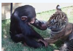
Una scimmia, due tigris e un lupo, ecco la lotta più spettacolare che abbiate...