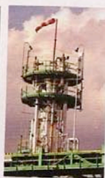
Primati 1 Il distretto industriale di Melfi il più produttivo al mondo.

molte regioni, non si mette in mostra, non sfoggia né esalta i suoi pur numerosi record ma ama stare nell'ombra e preferisce l'"understatement".