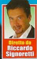
Diretto da Riccardo Signoretti

Lui è "lunatico"? Ecco come puoi gestirlo