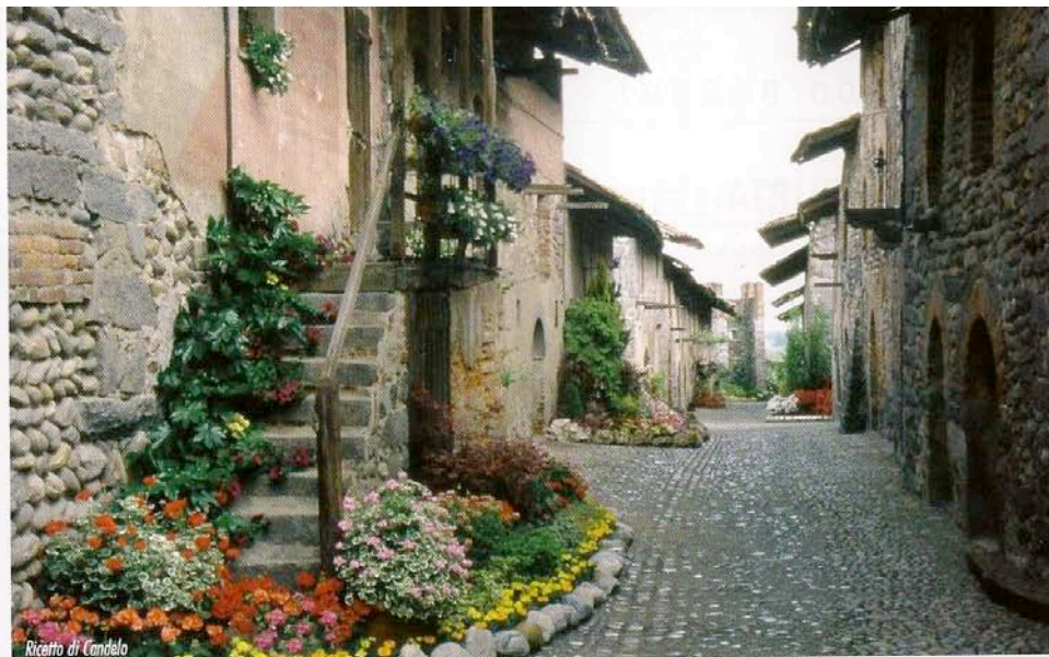
Ricetto di Candelo