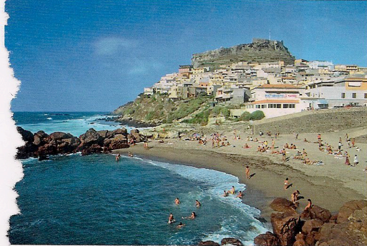
SOPRA: IL BORGO MEDIEVALE DI CASTELSARDO (SASSARI), SU UN IRTO PROMONTORIO ROCCIOSO. A DESTRA: NAVI DELLA GRIMALDI LINES.