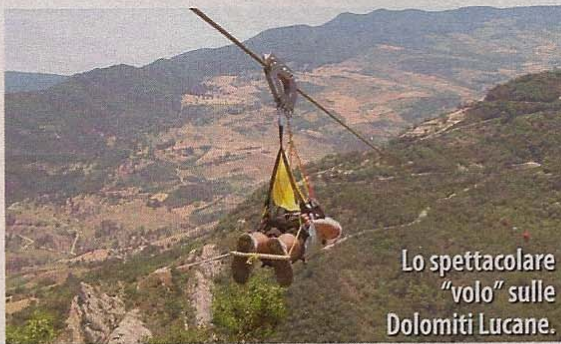
Lo spettacolare "volo" sulle Dolomiti Lucane.

Da borgo a borgo. Si vola da Castelmezzano a Pietrapertosa, due splendidi borghi arroccati sulle rocce d'arenaria delle Dolomiti Lu-