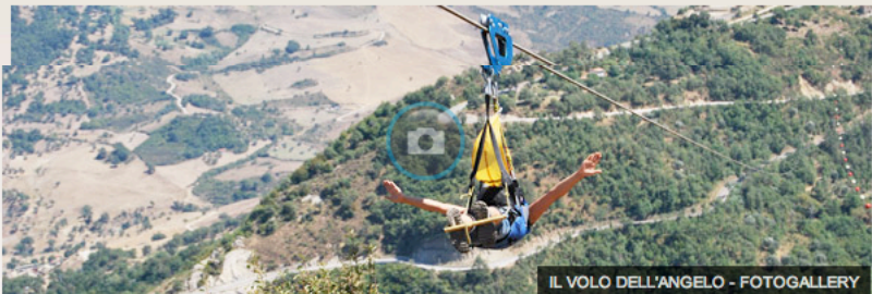
IL VOLO DELL'ANGELO - FOTOGALLERY

VOLO DELL'ANGELO: BASILICATA PER UOMINI CORAGGIOSI!