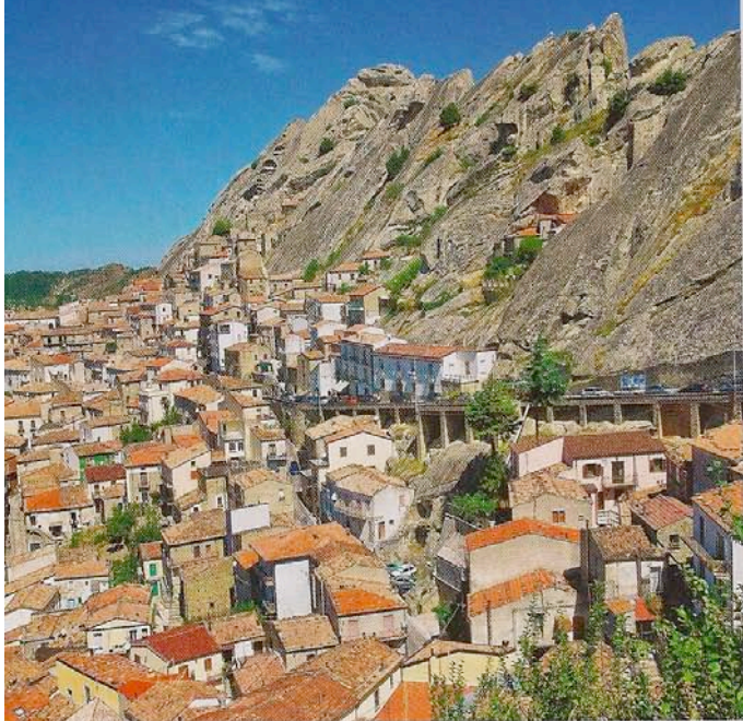
Sopra, Pietrapertosa. A destra: un piatto tipico e la casa Orsa Maggiore facente parte dell'albergo diffuso Le Costellazioni sulle Dolomiti Lucane. In apertura, il volo dell'angelo

quassù è possibile fotografare con lo sguardo le linee sinuose delle Dolomiti Lucane, come guglie di cattedrali naturali, che se fanno un grande effetto viste dal basso, sembrano ancora più imponenti viste dall'alto. Risalgono a 15 milioni di anni fa e dominano una natura costruita da rocce arenarie, sagomate dagli agenti atmosferici che per la loro particolare forma sono state ribattezzate affettuosamente "il Gufo", "la Civetta", "la Grande Madre", "l'Incudine".